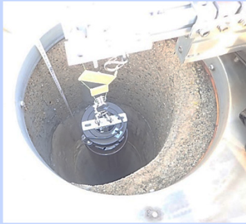
牽引式の撮影装置

狭い・暗いなどの理由から人の立ち入りが困難な天井裏や煙突などの内部状況を撮影し、安全かつ迅速に点検を行います。